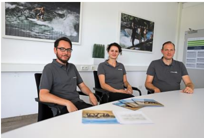
Bild 1: Informative Webinare stellen Best Practice Beispiele von führenden Web2Print Dienstleistern wie posterXXL vor.